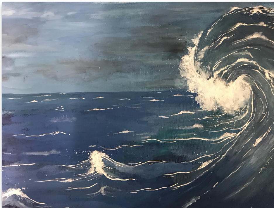
Erde, Feuer, Luft, Wasser (Thema 2019)