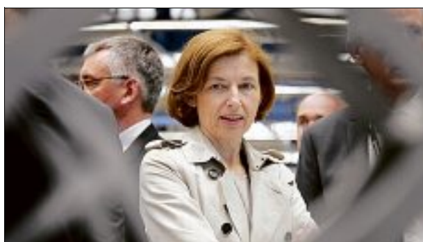
BOURGES. La ministre des Armées, Florence Parly, viendra évoquer l'Europe qui protège.

Le député de la première circonscription du Cher, François Cormier-Bouligeon (LREM), organise ce soir, à 19 heures, au Palais des sports du Prado, à Bourges, l'ultime réunion publique avant les élections européennes dans le Cher.